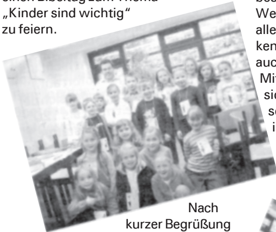
Nach kurzer Begrüßung

Am 24. September kamen ca. 50 Kinder in die Trinitatiskirche, um einen Bibeltag zum Thema „Kinder sind wichtig“ zu feiern.